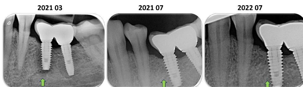
PERIIMPLANTITÍDA Stav po chirurg. liečbe, defekt bol vyplnený kolagénom H42

Pridelené kredity (21 + 21). Počet účastníkov je obmedzený. Po prednáškach sú praktické kurzy na modeloch, workshopy – rozbor kazuistík. Kurzy na seba nadväzujú, vhodné je absolvovať celý vzdelávací program.