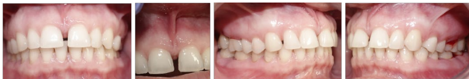
Žena, 1984, zdravá, nefajčí