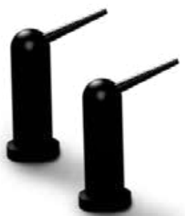
Odtlačok s V-Posil